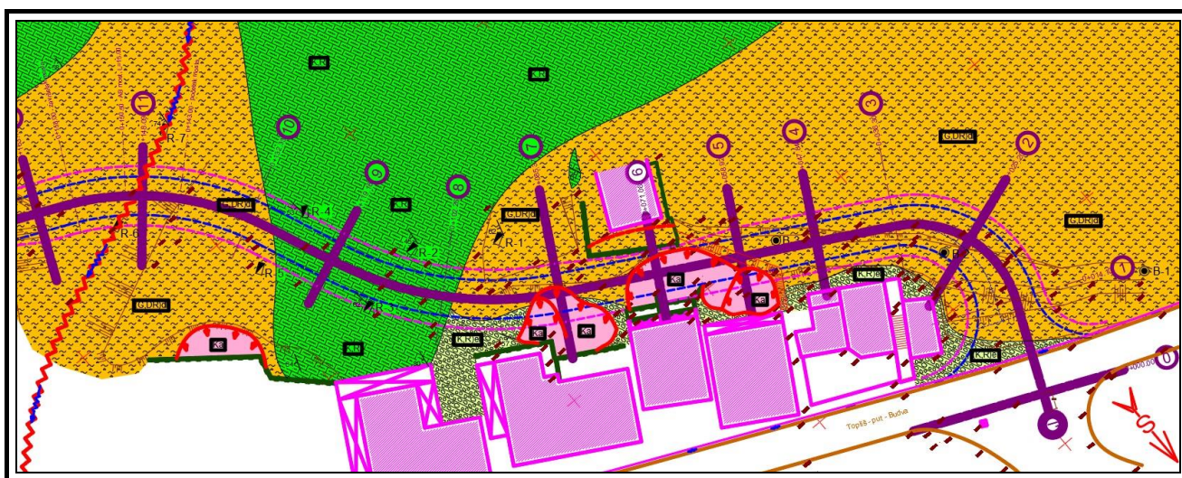
Inženjerskogeološka karta terena sa trasom ulice i istražnim radovima

Sa aspekta stabilnosti i sanacije terena na lokaciji Babinog dola, zaključujem sledeće: