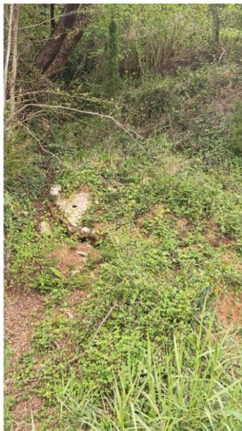
Mikro lokacija tačke 1