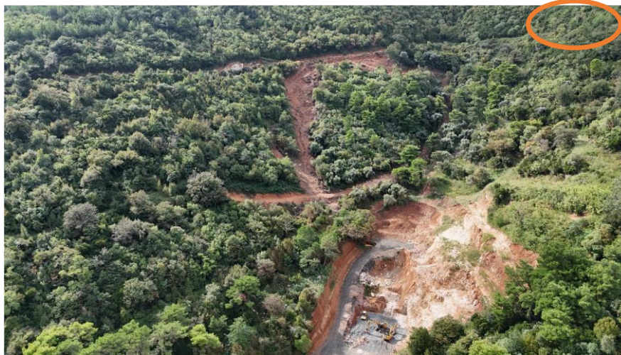
Približna makro lokacija lokacija tačke 1

Mesto početka drenažnog kanala u zoni jaruge Krivokapića potoka. Materijal iz iskopa je deponovan na obodu rova sa nizbrdne strane formirajući zaštitni nasip koji zadržava slivanje atmosfere vode niz padinu.