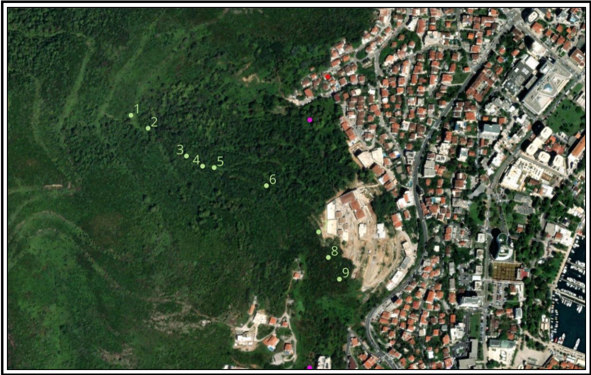
Tačke rekognosciranja (ESRI satellite)